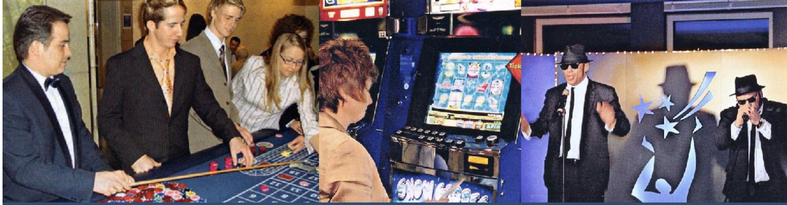
Projektbericht Casino Bremen – Neue Energie für Ihr Business